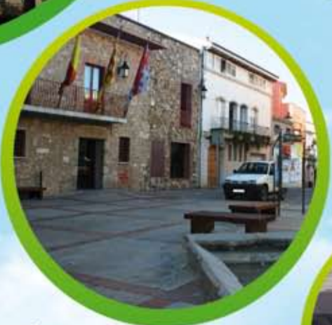
Ajuntament de Palafolls, Plaça Major